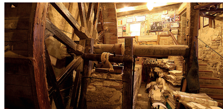
Santarcangelo - stamperia Marchi - mangano