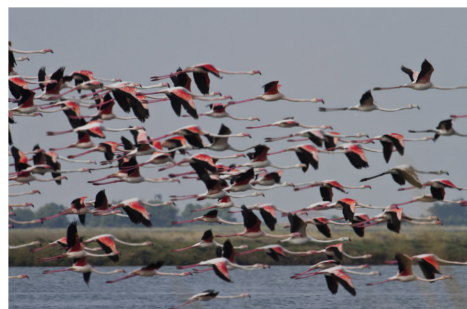
Cervia - salina

pino marittimo ( pinus pinaster ) nonché da querce, pioppi bianchi e robinie. Una curiosità: il pino non è un albero "autoctono" della pianura padana e di questa parte della costa adriatica. Le pinete devono la loro origine a motivi economici. Furono i Romani, in epoca augustea ad introdurle. Ne utilizzavano il legname per costruire navi e mantenere efficiente la flotta navale del porto di Ravenna. Alla caduta dell'Impero, le pinete sopravvissero e raggiunsero, nel '700, la loro massima estensione grazie alle comunità monastiche locali, che travevano dall'essere proprietari del bosco un appropriato sostentamento.