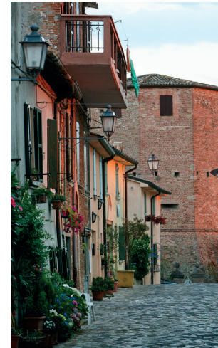
Santarcangelo - borgo

un florido sviluppo e si riappropriò della pianura. Edifici nobili si affiancarono a quelli popolari ben integrandosi, dando forma all'attuale assetto urbano del centro storico.