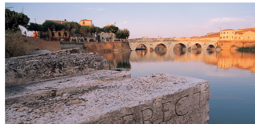
Rimini - ponte di Tiberio