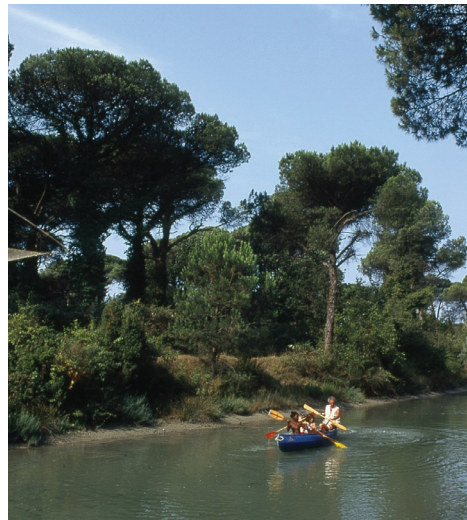
Cervia - pineta

La pineta di Cervia è la parte più meridionale di quel bosco cantato nei secoli scorsi da Dante e Byron. Attualmente la sua estensione è di 260 ettari, a cui si aggiungono ulteriori 27 ettari del Parco Naturale istituito nel 1963. La vegetazione è caratterizzata dalla presenza di due specie di pini mediterranei: il pino da pignoli o pino domestico ( pinus pinea ) e il