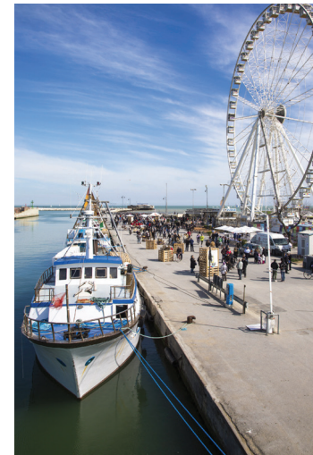
Rimini - porto canale