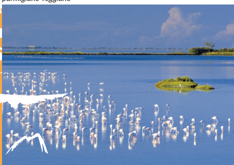
parco del Delta del Po