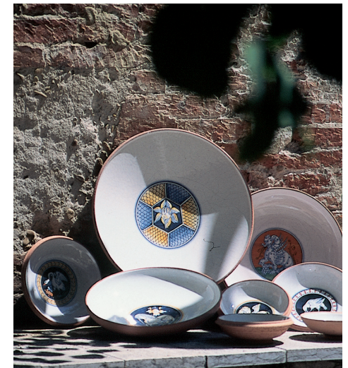
ceramica di Faenza