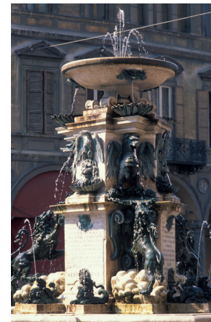
Faenza - fontana monumentale