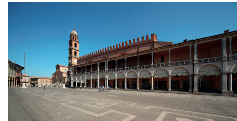
Faenza - piazza del Popolo

epoca medievale e ottocentesca. Da non perdere: la visita a una bottega per vedere gli artisti all'opera dal vivo o la partecipazione ad un laboratorio didattico per apprendere le tecniche base di manipolazione della creta e del decoro.