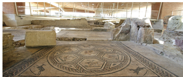
Rimini - domus del chirurgo

Il Museo propone un'ampia e qualificata offerta formativa rivolta ad adulti e bambini (laboratori didattici, atelier, narrazioni animate, visite guidate pluri-sensoriali), come ad esempio "Il libro di Orfeo", che sarà proposto ai nostri viaggiatori, come modalità di visita della sezione archeologica.