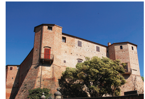
Santarcangelo - Rocca Malatestiana