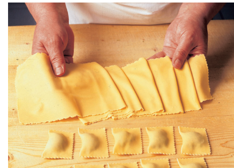
sfoglia lavorata a mano