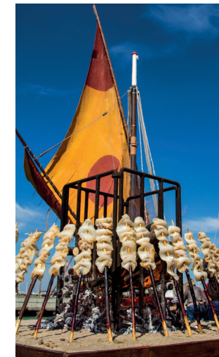
spiedini di pesce