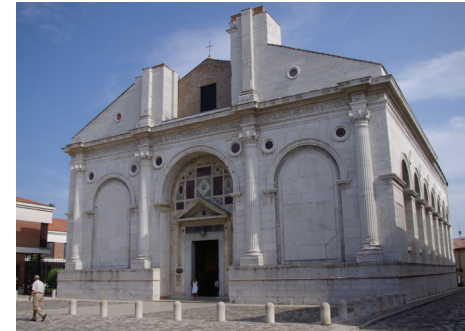
Rimini - Tempio Malatestiano