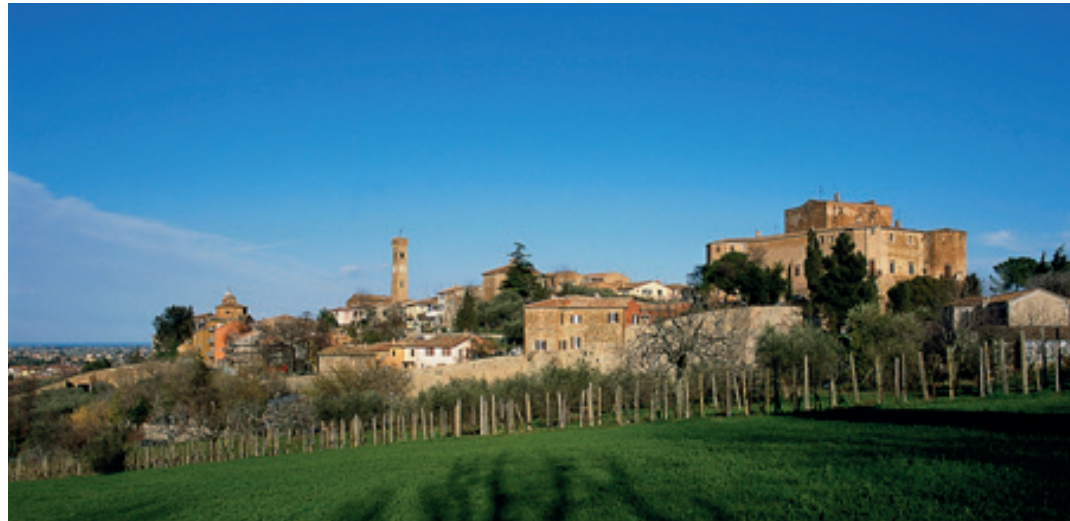
Santarcangelo - veduta panoramica

Nasce in età romana, collegata alla centuriazione della Pianura Padana ed è caratterizzata, in quest'epoca, dalla presenza di fornaci. La Via consolare Emilia, che ancora oggi l'attraversa, favorì lo sviluppo del commercio e la trasformazione dell'insediamento in un vivace ed operoso centro di scambi e incontri. Nel medioevo l'abitato venne spostato dalla pianura sul Colle Giove, dove ancora oggi è ben riconoscibile la struttura di borgo fortificato. Sulla sommità venne eretta una possente rocca , passata, nel XIII secolo, nelle mani dei Malatesta (la signoria che dominò per un paio di secoli questo angolo della Romagna). Tra il '700 e l'800 il borgo ebbe