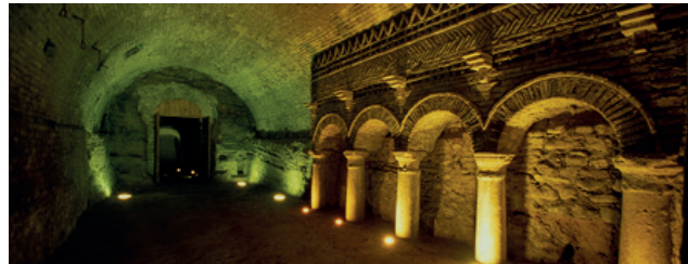
Santarcangelo - grotte tufacee