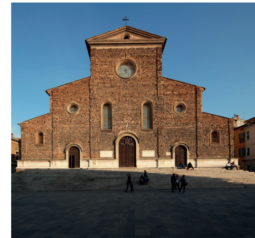
Faenza - duomo