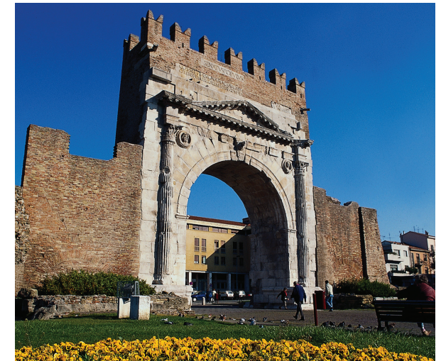
Rimini - arco d'Augusto